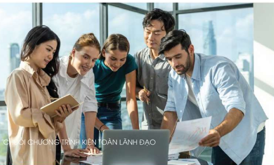
CHUỖI CHƯƠNG TRÌNH KIẾN TOÀN LÃNH ĐẠO

Sử dụng phản hồi này để điều chỉnh cách tiếp cận và tận dụng các kỹ năng đạt được trong suốt chương trình.